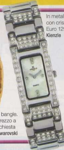
In metallo con cristalli. Euro 129 Kienzle