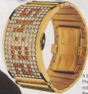
A bangle. Prezzo a richiesta Swarovski