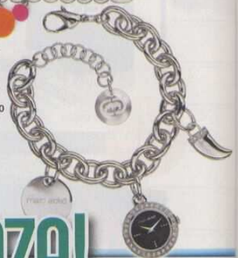
Maglia a catena e corno. Euro 89 Marc Ecko Watches