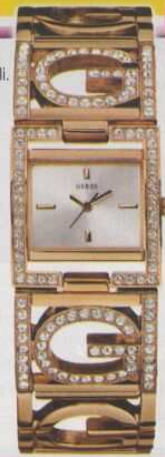
Cinturino rigido. Euro 179 Guess Watches