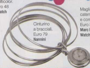
Cinturino a bracciali. Euro 79 Nannini