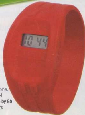
In silicone. Euro 24 A-Style by Gb Partners