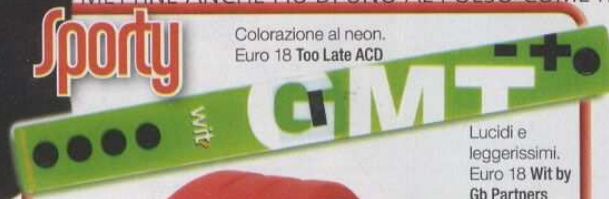
Lucidi e leggerissimi. Euro 18 Wit by Gb Partners